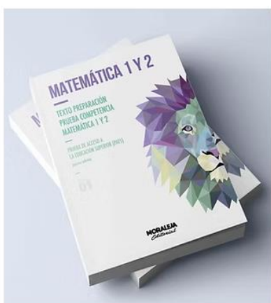
Matemática M1 y M2 | 10ª ed Texto preparación prueba competencia Matemática 1 y 2.