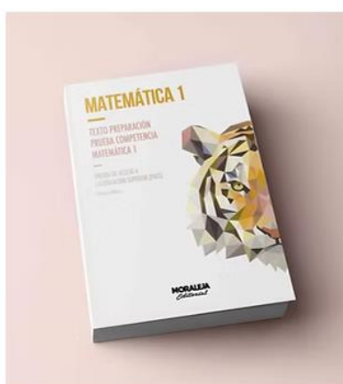
Matemática M1 | 10ª ed Texto preparación prueba competencia Matemática 1.