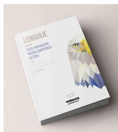
Lenguaje | 7ª ed Texto preparación prueba competencia Lectora.